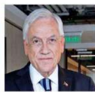
Sebastián Piñera EXPRESIDENTE DE CHILE