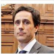
Luis Silva EXCONSEJERO CONSTITUCIONAL PARTIDO REPUBLICANO

INAUGURACIÓN DE CENTRO DE ATENCIÓN Y REPARACIÓN PARA VÍCTIMAS DE VIOLENCIA SEXUAL, 29 DE NOVIEMBRE "Por su compromiso (de las mujeres) permanente con las demandas por una mayor igualdad de género y en contra de la violencia a las mujeres y por su determinación de que en nuestro país no se puede retroceder en los derechos que ustedes se han ganado".