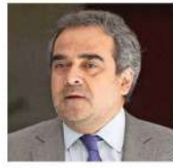
Jaime Quintana SENADOR Y PRESIDENTE DEL PPD

DISCURSO TRAS ELECCIÓN DE CONSEJEROS, 7 DE MAYO "Tenemos que tomar con mucha humildad y responsabilidad que millones de chilenos nos han encomendado. Somos el partido más votado y somos los más responsables hoy día de sacar adelante nuestra patria. Que nunca más el sectarismo se apodere de nuestra patria. Somos nosotros los que tenemos que trabajar con fuerza, pensando en los demás, siempre mirando el bien de Chile".