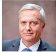
José Antonio Kast LÍDER DEL PARTIDO REPUBLICANO

EN SU PROGRAMA DE YOUTUBE, 20 DE SEPTIEMBRE "Esta propuesta, como está quedando, no tiene ninguna posibilidad. Va a dividir mucho más a los chilenos y va a ser una regresión significativa en derechos sexuales y reproductivos de las mujeres (...) y un retroceso enorme en derechos sociales. Vamos a estar trabajando para conquistar por fin una asamblea constituyente de verdad que nos permita escribir una nueva Constitución para Chile".