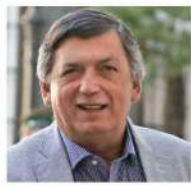
Lautaro Carmona PRESIDENTE DEL PC

PUNTO DE PRENSA, 25 DE OCTUBRE "Respecto al proceso que estamos viviendo, la primera pregunta es si nos una como sociedad, y yo debo confesar que siento frustración por el hecho de que este proyecto no haya recibido un respaldo más amplio. Pero ya hay un texto, que me he dedicado a estudiar, y decidí votar a favor, porque me parece que el borrador, en general, es un buen texto".