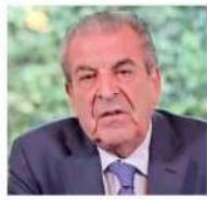
Eduardo Frei EXPRESIDENTE DE CHILE

EL PAÍS, 4 DE NOVIEMBRE "Estoy por el rechazo porque no veo que esta propuesta constitucional nos ayude a cohesionarnos como chilenos, como sociedad. Es un texto que, a pesar de todo lo que hizo la Comisión de Expertos en favor de lograr un consenso, fue desarticulado en la etapa final por el Consejo Constitucional".