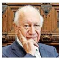
Ricardo Lagos EXPRESIDENTE DE CHILE

LA TERCERA, 10 DE DICIEMBRE "De mi punto de vista personal, que no implica un vínculo con la responsabilidad que tengo en la universidad, creo que es un texto que no es lo que dice ser".