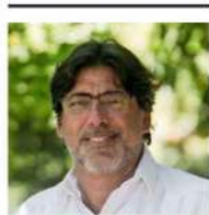
Daniel Jadue ALCALDE DE RECOLETA

DECLARACIÓN PÚBLICA, 23 DE NOVIEMBRE "Votaré a favor con total tranquilidad pues creo que es lo mejor para nuestro país. Invito a todos los actores de la sociedad a analizar con calma y en profundidad lo que ha ocurrido en estos cuatro años y así comprendamos que la intransigencia es contraria al desarrollo y futuro de nuestro Chile".