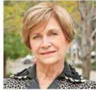
Evelyn Matthei ALCALDESA DE PROVIDENCIA

LA TERCERA, 8 DE OCTUBRE "Naturalmente, los consejeros y consejeras tienen toda la legitimidad política para revisar y trabajar sobre el texto del anteproyecto. Ahora bien, hay que decir que se hicieron cambios muy sustantivos al anteproyecto que desbalancearon el equilibrio que se había logrado en la Comisión Experta, y hay que tener conciencia de que esas decisiones tienen un impacto".