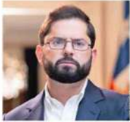
Gabriel Boric PRESIDENTE DE CHILE

VISITA A REGIÓN DEL BÍO-BÍO, 31 DE OCTUBRE "Se cometieron errores que también se cometieron en el proceso anterior (...). Acá no hubo una propuesta ni de cerca de ser de consenso; finalmente, se impuso la mayoría circunstancial que hubo en el Consejo, tal como la vez anterior se impuso esa mayoría circunstancial".