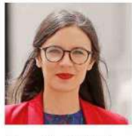
Camila Vallejo MINISTRA VOCERA DE GOBIERNO

RADIO DUNA, 14 DE NOVIEMBRE "Me equivocó (al votar Apruebo). Nosotros aprendimos de ese error. Ambas propuestas tienen las mismas características desde el punto de vista programático, aun cuando el mérito del programa sea distinto". "El Consejo repite los mismos errores de la Convención, en el sentido de utilizar una mayoría para determinar programáticamente, a veces, el contenido de ese texto".