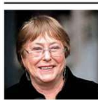
Michelle Bachelet EXPRESIDENTA DE CHILE

EL MERCURIO, 12 DE NOVIEMBRE "Para la izquierda solo será válida una Constitución que algún día puedan escribir ellos y a su antojo. Por eso voto a favor, porque independiente de la alternativa que triunfe en diciembre, este debate no se cerrará, y mientras más votos tenga esta propuesta, en mejor posición quedará la democracia liberal para enfrentar los debates que vendrán".