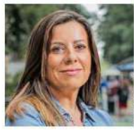
Teresa Marinovic EX CONVENCIÓNAL CONSTITUYENTE

LA TERCERA, 29 DE OCTUBRE "Se la farreó un sector, ahora se la farrea el otro extremo. Y yo creo que eso es tremendamente preocupante. Una Constitución más a la derecha que la actual puede ser el detonante de un nuevo estallido social aún mayor que el de 2019".