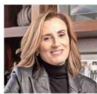
Marcela Cubillos EXCONVENCIÓNAL CONSTITUYENTE

RADIO PAUTA, 19 DE OCTUBRE "Si analizamos todos los acuerdos que ha habido en materia económica, a mí me parece que el texto que hoy tenemos da para cerrar y para ser aprobado". "Desde nuestro punto de vista, lo que tenemos que mirar es el futuro, tenemos que cerrar esos espacios de incerteza jurídica y podemos dar realmente un paso importante en materia de atracción de inversiones".