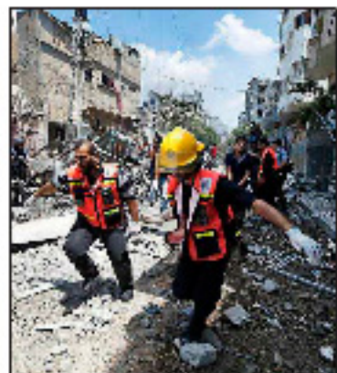
Los combates se contraron ayer principalmente en el barrio de Shajajaya, en el área norte de la ciudad.