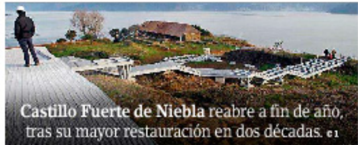
Castillo Fuerte de Niebla reabre a fin de año, tras su mayor restauración en dos décadas. C 1

Chefs y científicos se unen para reinventar las algas chilenas como platos gourmet. A 12